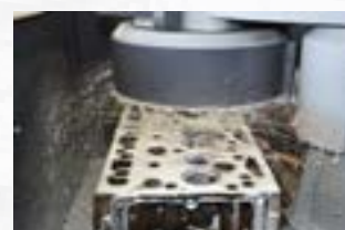
Usinage avec arrosage