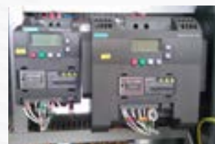
Deux variateurs de vitesse