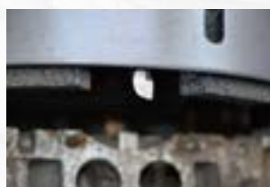
Plateau de meule