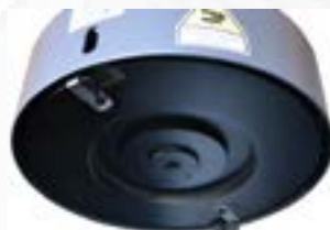
Plateau de fraisage avec plaquette CBN/PCD